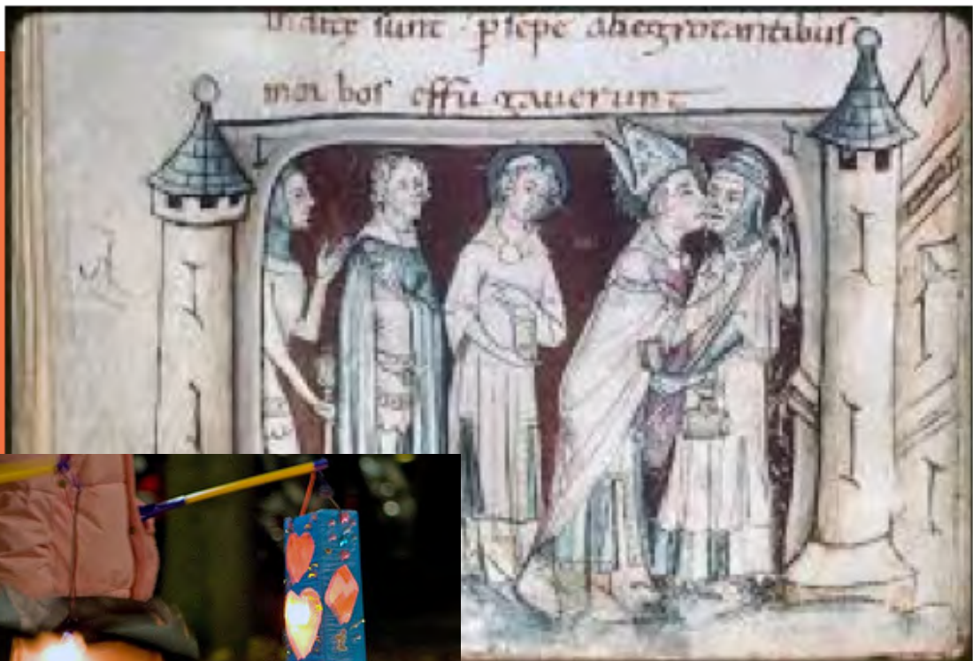
Martinus en de lepralijder, basiliek van Saint Ouen in Rouaan.